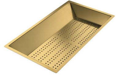
Vaschetta forata inox PVD Gold