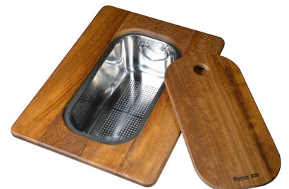
Tagliere Twin in legno Iroko con vaschetta scolapasta in acciaio inox 8644 044