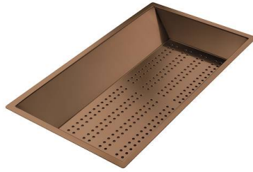
Vaschetta forata inox PVD Copper

* solo in abbinamento con l'accessorio 8644 101