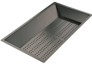
Vaschetta forata inox PVD Gun Metal