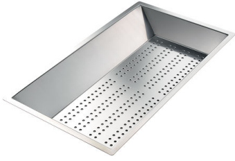
Vaschetta forata inox