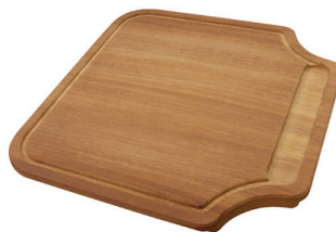
Tagliere in legno Iroko 8646 000